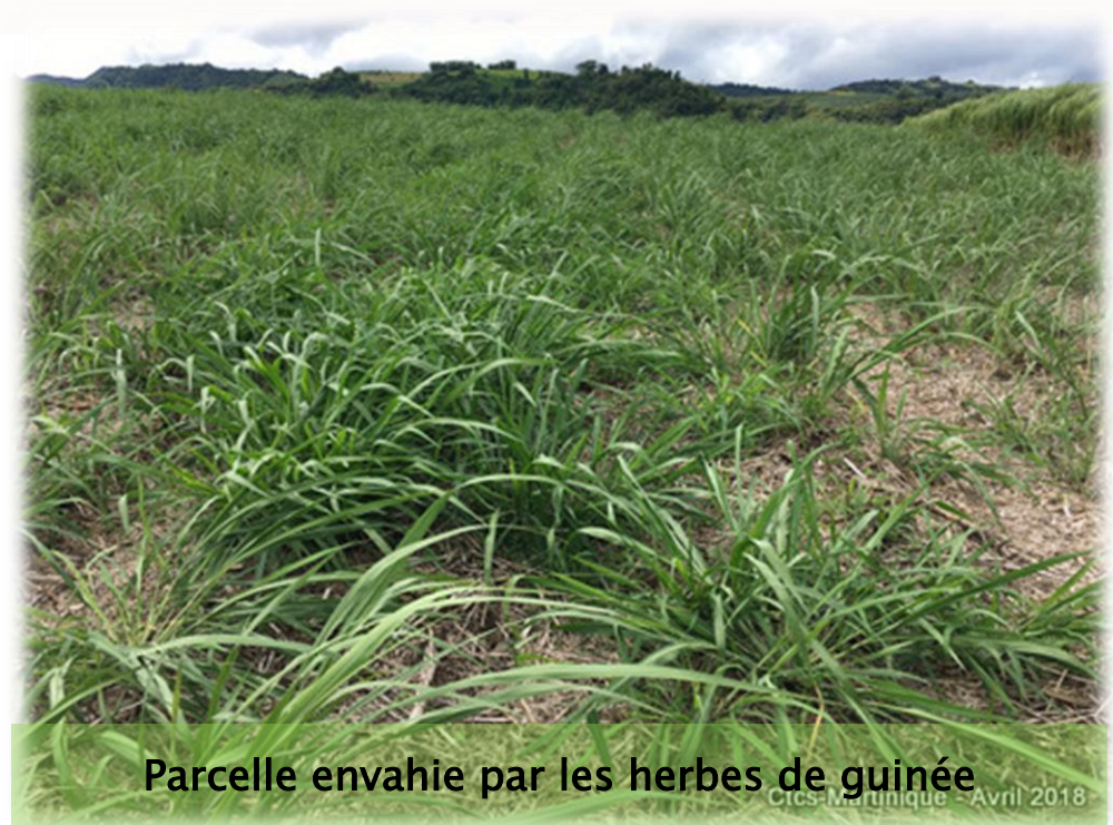
Parcelle envahie par les herbes de guinée

Arrachage des touffes d'herbes de guinée à la pioche ou à la houe. Toutefois, cette tâche est chronophage, physiquement contraignante et peu valorisante.