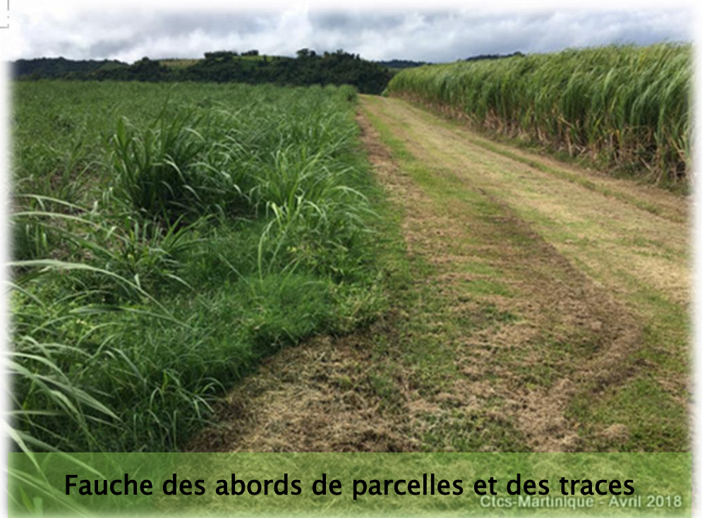
Fauche des abords de parcelles et des traces