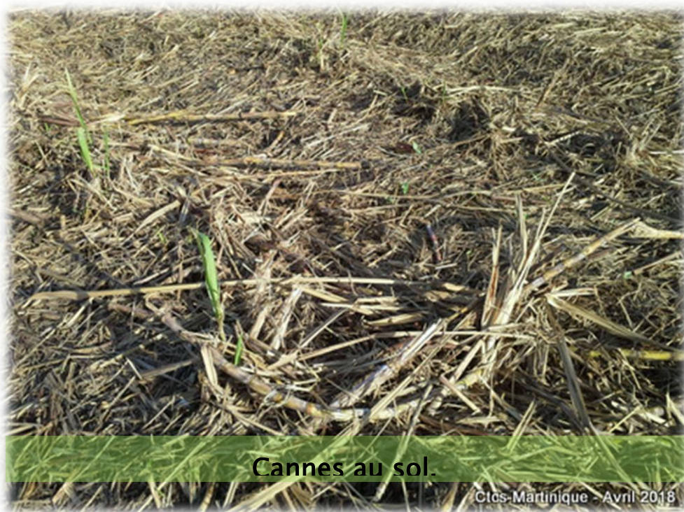
Cannes au sol.