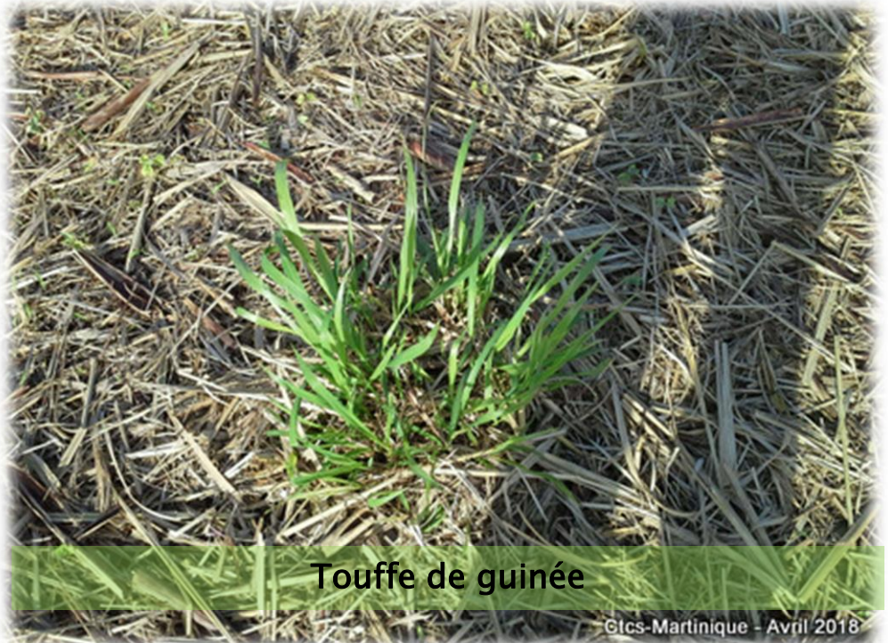
Touffe de guinée