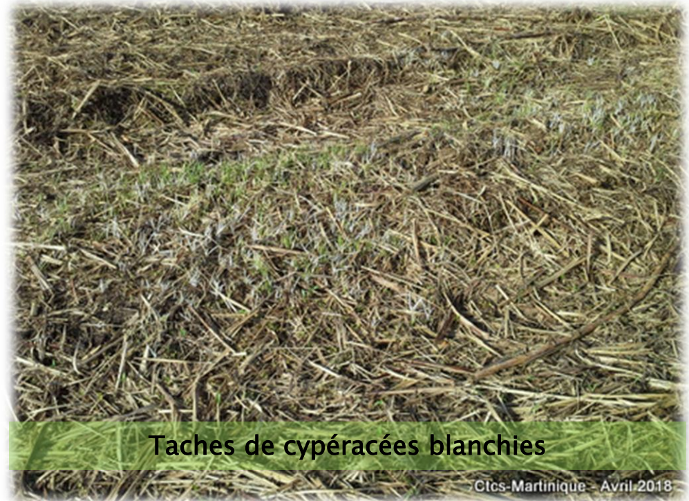
Taches de cypéracées blanchies

METHODES ALTERNATIVES : Arrachage des touffes d'herbe de guinée à la pioche ou à la houe. Toutefois, cette tâche est chronophage, physiquement contraignante et peu valorisante.