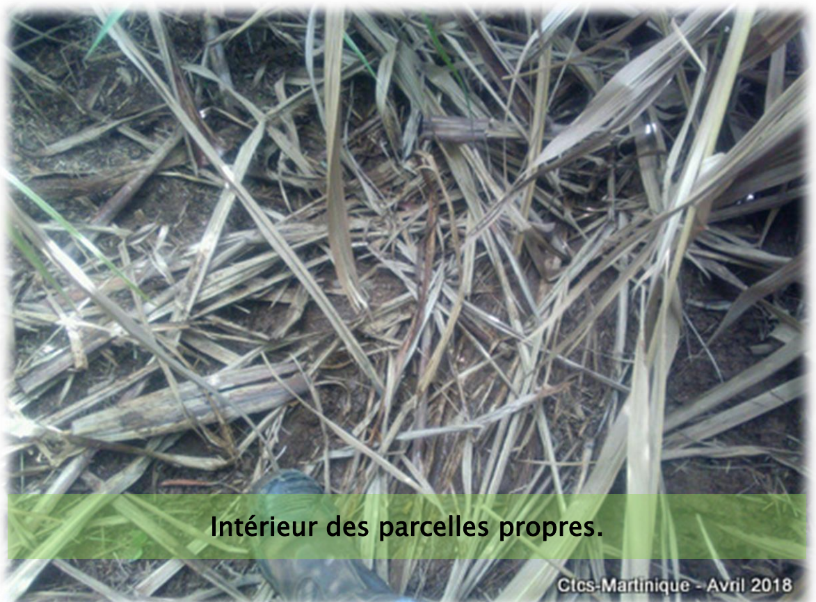
Intérieur des parcelles propres.

PROPHYLAXIE : Maintenir les canaux et les traces propres.