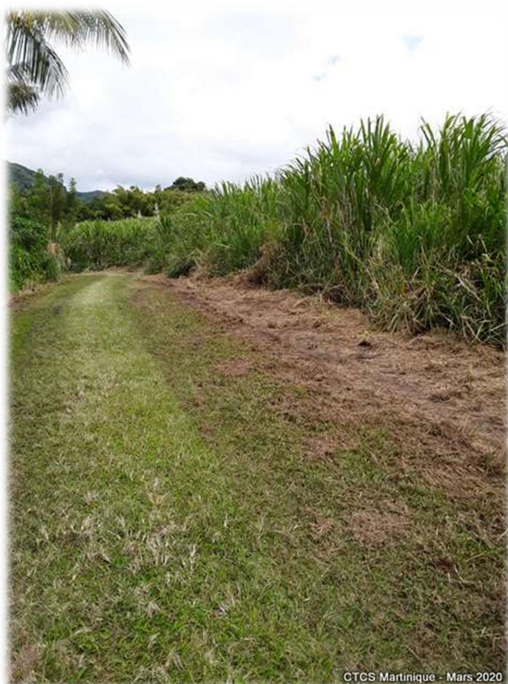
Entretien des bordures