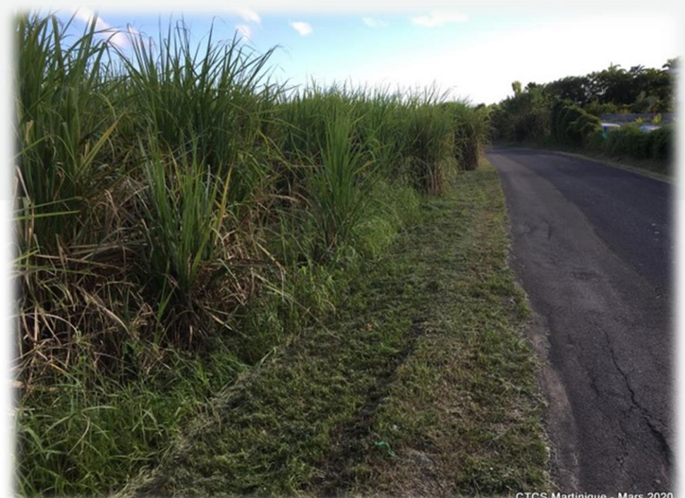
Entretiens des bordures

Adventices : Durant le premier trimestre, l'enherbement se maintient autour de 7% du fait de la sécheresse. Il est constitué en majorité de Centrosema pubesens .