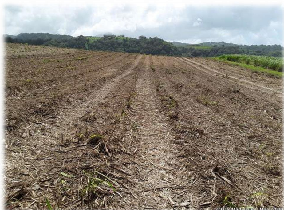
15 jours après récolte

METHODES ALTERNATIVES : Sarclage inter-rangs et extirpation manuelle de Guinée avant grenaison de préférence.