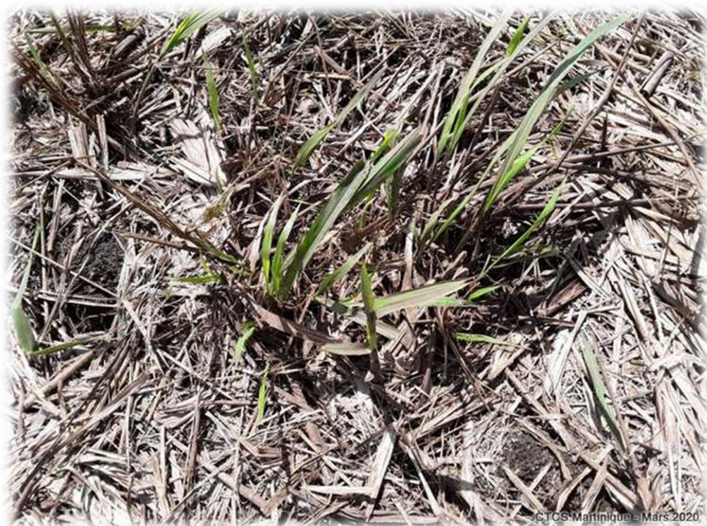
Souche de guinée