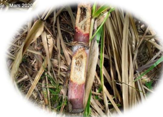
Attaques de rats