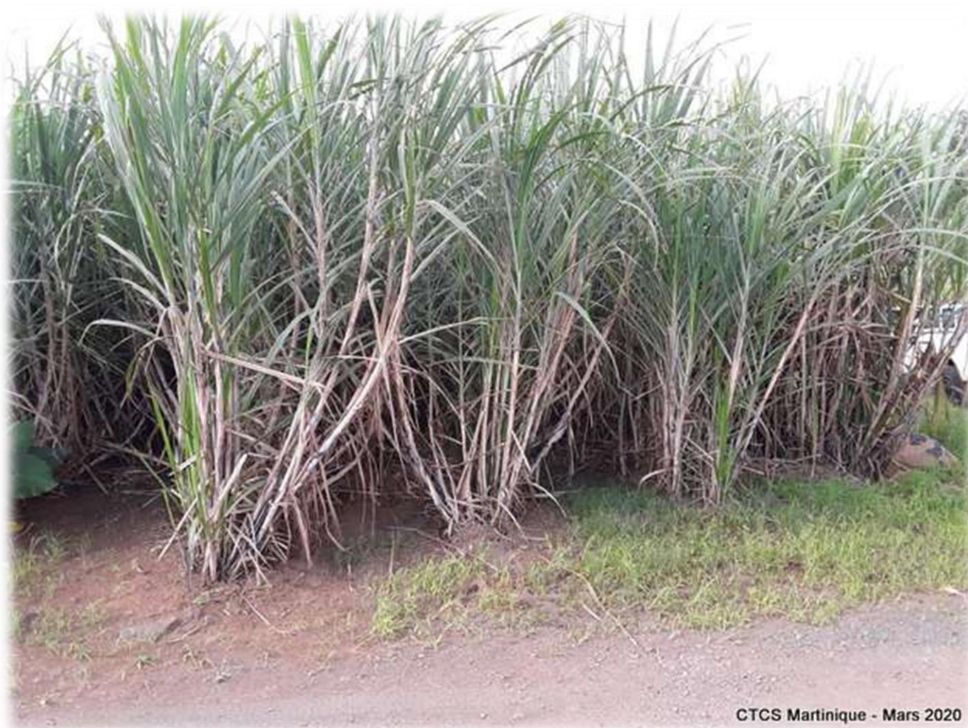
Vue générale du champ