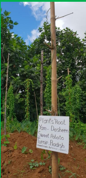
Cultures et panneaux signalétiques

Adresse de l'exploitation : Quartier Pérou, Commune de Sainte Marie